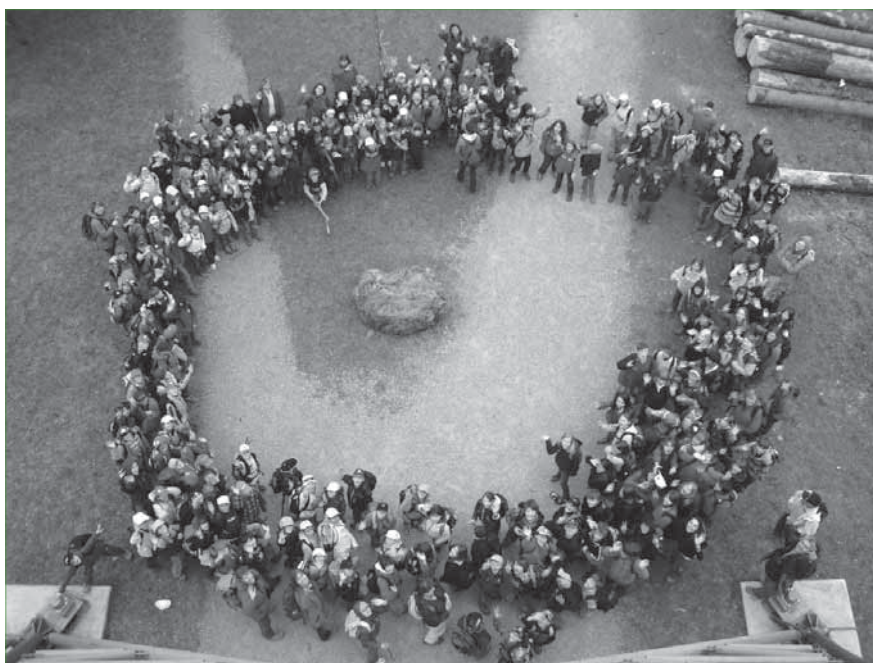
Gipfeltreff 2010 auf dem Bachtel.