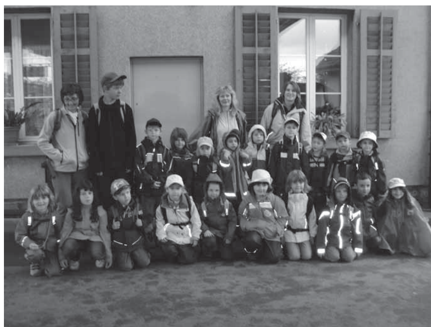
Die Kindergartenklasse der Burg Edelstein hat auf ihrer Reise einen Besuch auf der Kyburg gemacht.