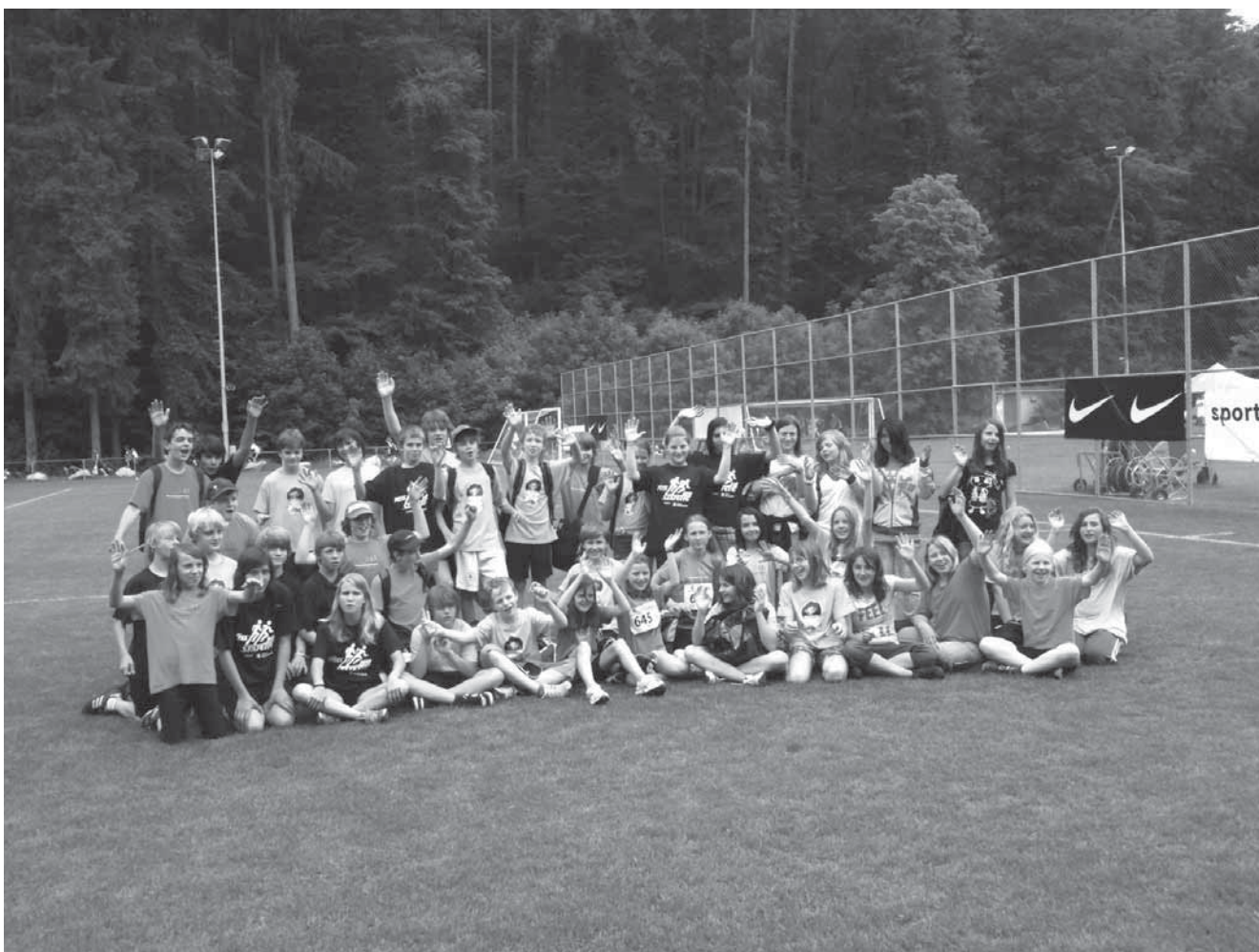
Die 5./6. und 6. Klasse an der Tössstafette