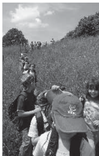
Kindergartenreise von Rutschwil zur Mörsburg mit einer fröhlichen Schar.