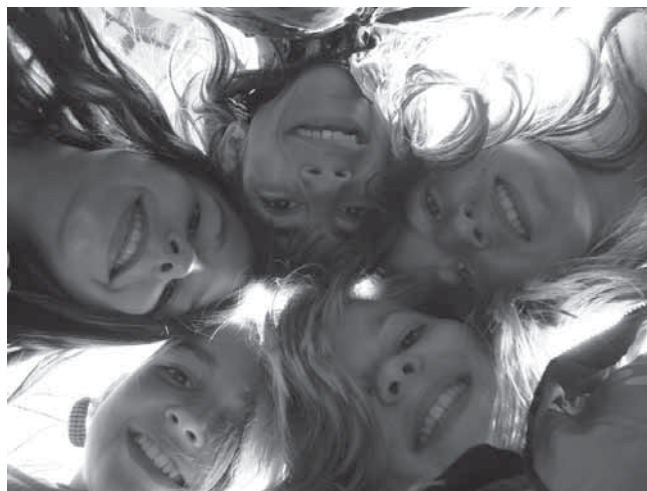
Die 6. Klasse als Stadtentdecker in Zürich unterwegs.