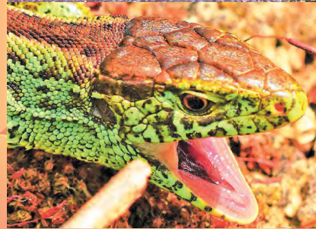
Autor: Sebastian Bräker